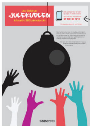
SMS-julekalender BØRN & UNGE

Plakat A2 PDF. SMS-julekalenderen "Julen er hjerternes fest" af Merete Pryds Helle.