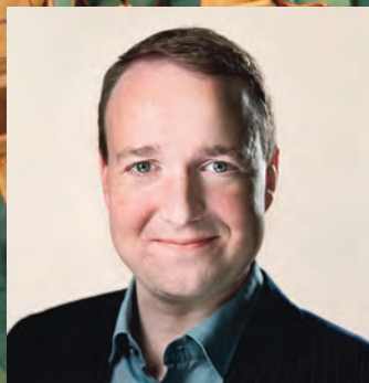
Michael Aastrup Jensen (V)