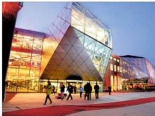
Mangebiblioteket på Kulturværftet i Helsingør er bygget i mangeartede stål og trækker masser af borgere til. Her strømmes læselysten hos unge og ældre med forskellige tilfælder, Skoleinspektør-Blog og Nyttig til at søge i online databaser, skriver Steen E. Andersen.

Bibliotekerne har til opgave at fremme oplæsning, uddannelse, kulturel aktivitet. Der er imidlertid stor for-