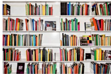
DANNELSE. Biblioteker er afgørende for vores dannelse, siger kulturministeren, der er på tur for at høre unge og gamle om deres syn på sagen.

»Men det, der trækker folk ind på biblioteket, er ikke bogen. Det gør aktiviteter, hvor man mødes med andre i et fælles forum og får en oplevelse. Det er fint med legoland og fastspil Sommerland, men det bliver så materiel. Biblioteket giver noget helt andet.