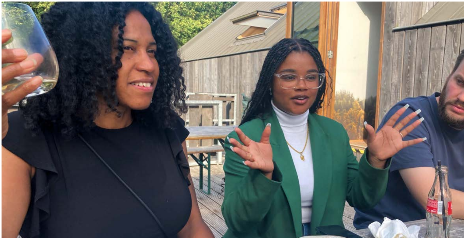
Lokal debat om OBA Next og ønsker til stedet.