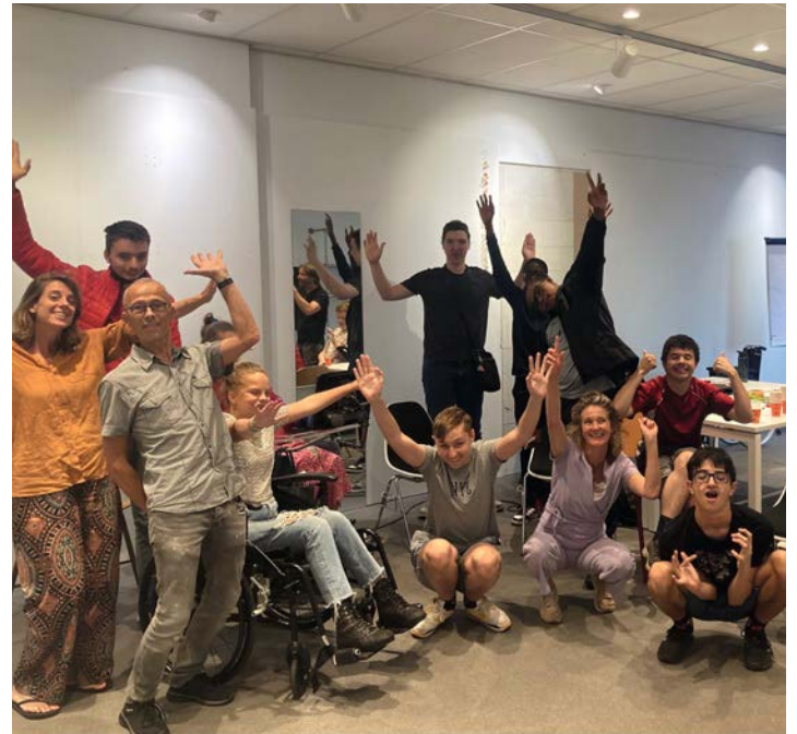
Getting-to-know-møder afholdes med alle lokale interessentgrupper.

Vi mener, at et ægte demokratisk samfund kræver en sådan overgang, og at et fremtidigt bibliotek skal oprettes, organiseres og drives i overensstemmelse med disse principper. Derfor vil idéer og resultater fra de aktuelle og kommende lokale fælles