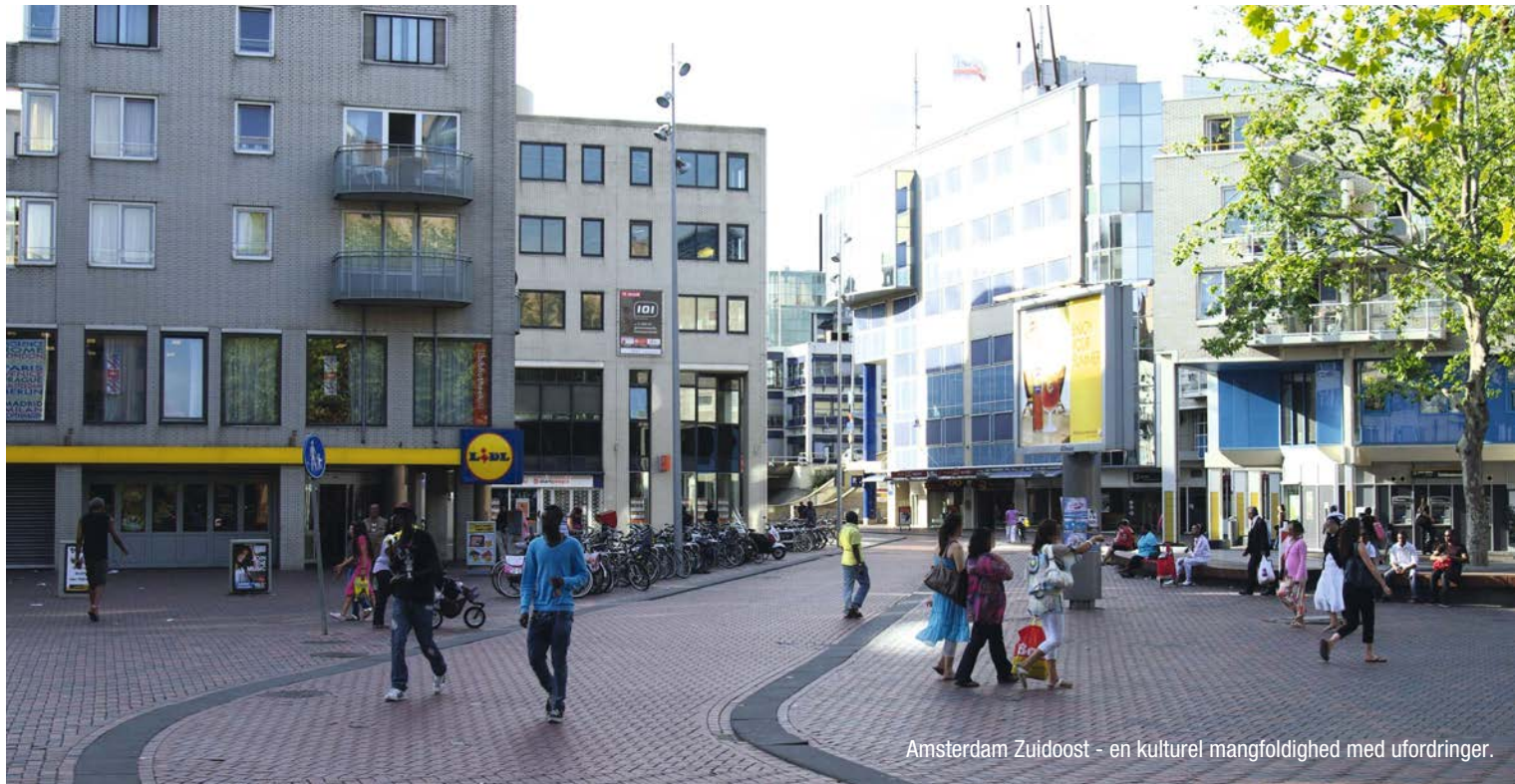
Amsterdam Zuid-oost - en kulturel mangfoldighed med udfordringer.