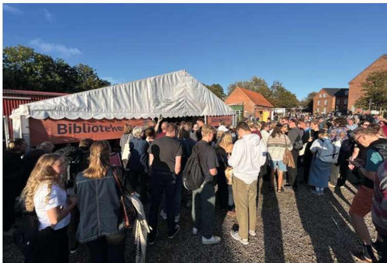
Stort fremmøde til Kulturmødet og til debatterne i Bibliotekernes telt.