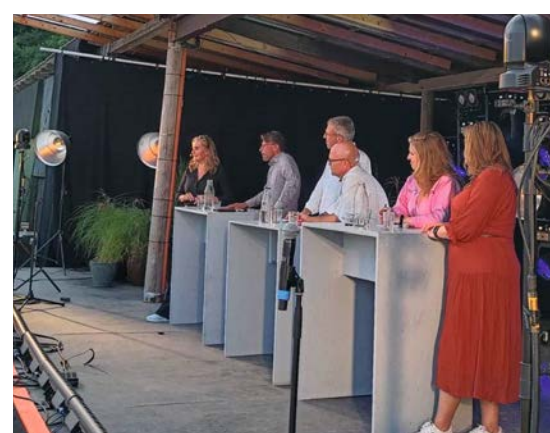
En sammenhængende indsats mellem aktører på kulturområdet er nødvendig. Hvordan skaber vi den, drøftede panelet med kulturordførere fra Folketinget.