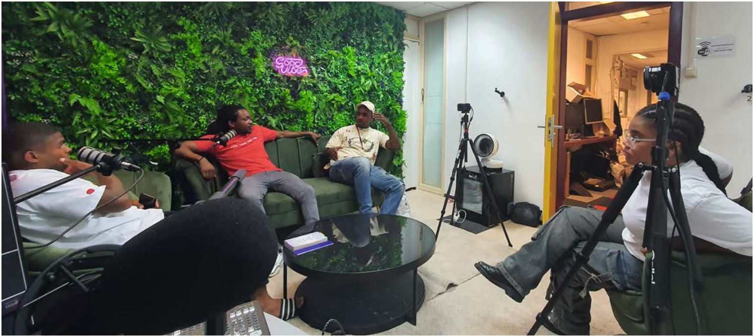
Idédebatterne foregår ad mange kanaler bl.a. i det lokale Young Minds Podcast Studio.

Blandt initiativerne er en podcast-serie og en TikTok kanal, som unge selv har udviklet og styrer, et børneråd med deltagere mellem 8 og 12 år, OBA Next's deltagelse i elektronisk musikfestival samt to fysiske lokationer i området, hvor forskellige aktiviteter kan foregå. Desuden er der etableret en intern tænketank, hvor der er rekrutteret interesserede personer fra de øvrige 27 biblioteker i Amsterdam, som skal komme med input til udviklingen af OBA Next, ligesom der har været afholdt internationalt symposium om fremtidens bibliotek i samarbejde med Bloomberg Center for Public Innovation fra Johns Hopkins University.