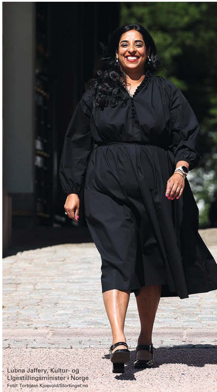
Lubna Jaffery, Kultur- og Ligestillingsminister i Norge

- Vi har mange gode forsamlings og arenaer, der skal være tilgængelige for folk. Det er da vigtigt, at vi ikke gemmer det mær-