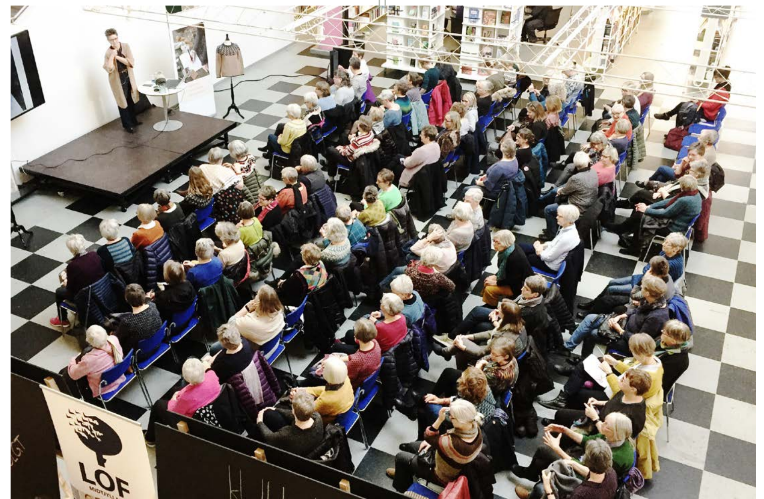
Strikkeforedrag på Viborg Bibliotek med efterfølgende strikkekursus i LOF Midtjylland.

Skolelederen appellerer til, at man ringer til hinanden, at parterne snakker sammen om tingene. Man skal være ærlige om denne problematik. Eventuelt kan man debattere disse gråzoner i kommunens fælles aftenskolesamråd, hvis man har et sådant lokalt, eller involvere sin lokale kulturforvaltning i problematikken.