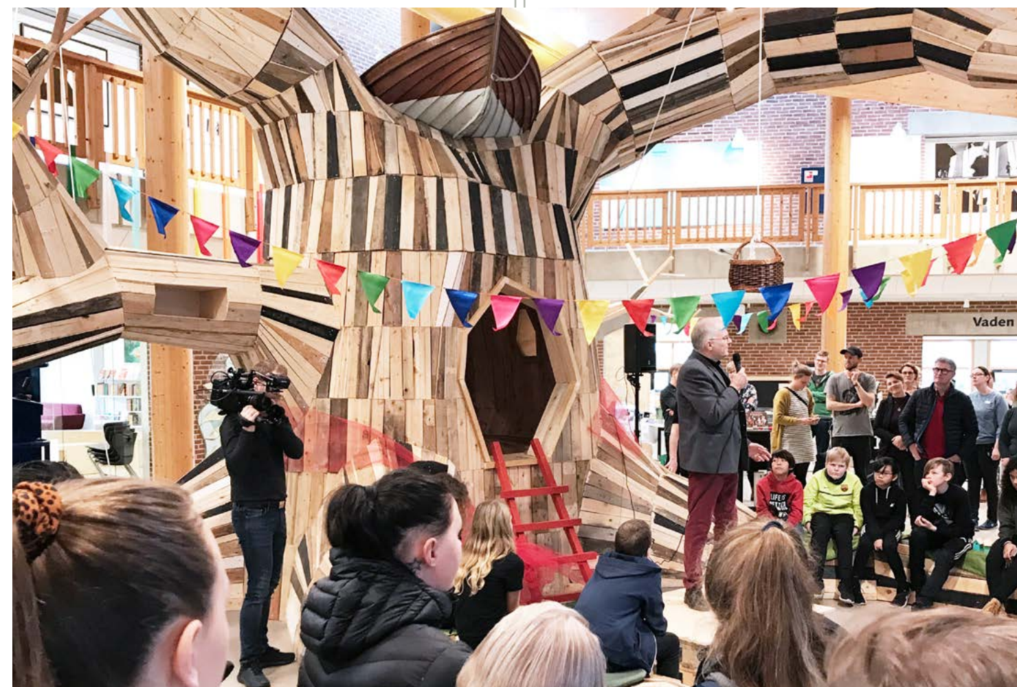
Debatarrangementer under Fortælletræet på Esbjerg Bibliotek.