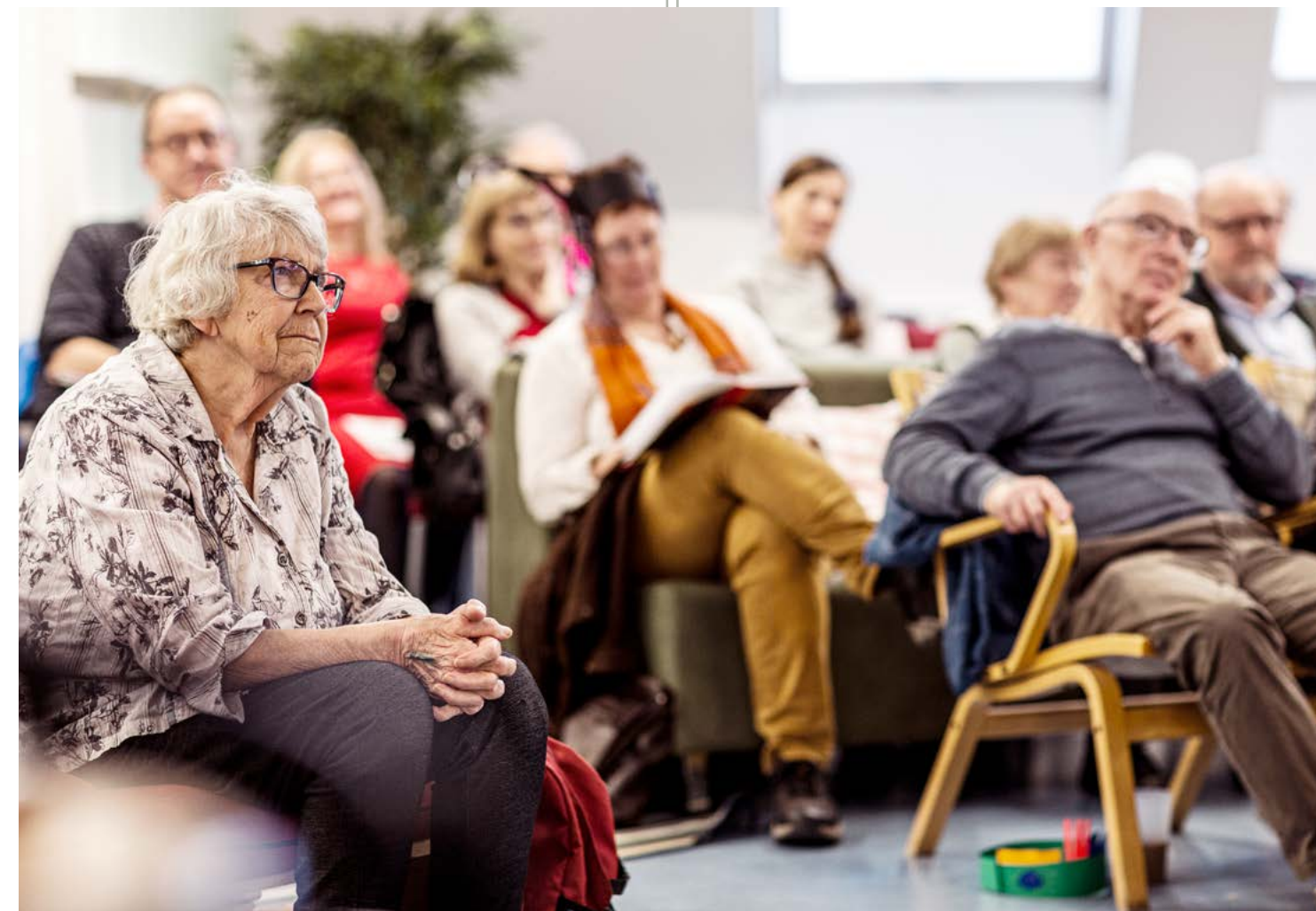
Debatarrangement bl.a. i samarbejde med AOF Vestegnen ved Festival om FN's verdensmål på biblioteket.