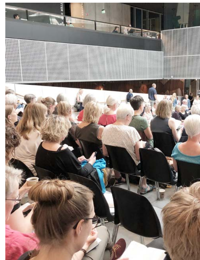
Højskole-marathonsang på Dokk1.

Nyt projekt på vej om udvikling af lokal- og nær-demokrati. Foreløbige samarbejdspartnerne er Aarhus Kommune, Biblioteker i Aarhus, Aarhus Stiftstidende, Folkeuniversitetet, Danmarks Medie- og Journalisthøjskole samt folkeoplysningsforbund.